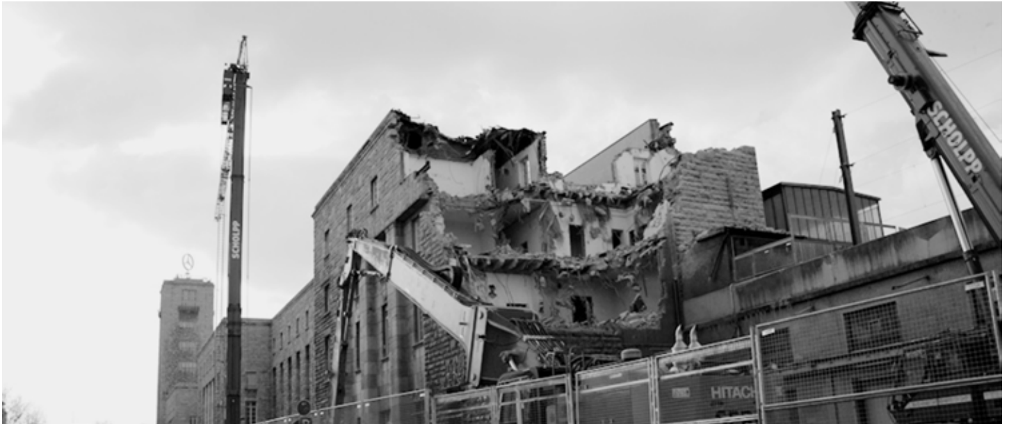
Erst zerstören, dann planen: schweres Gerät beim Abbruch des Bahnhof-Südflügels

NEUES VOM DÜMMSTEN BAHNPROJEKT DER WELT – AUSGABE 4 • 9. FEBRUAR 2012