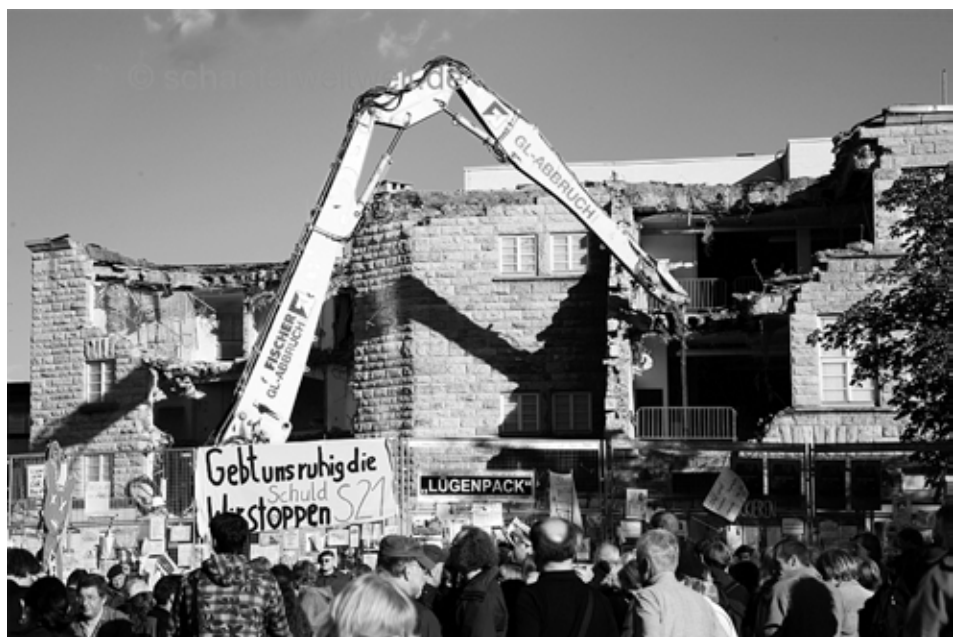
Abriss des Bahnhof-Nordflügels im August 2010. Bis heute ist das Gelände eine Baubrache.

Mittwoch, 15. Februar, 19:00 Uhr: Stresstest – was nun? Bürgerhaus S-Feuerbach, Stuttgarter Str. 15, 1. OG; Veranstalter: NaturFreunde Feuerbach & Initiative Feuerbach für K21